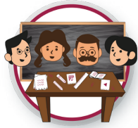
Sala de Maestras y Maestros